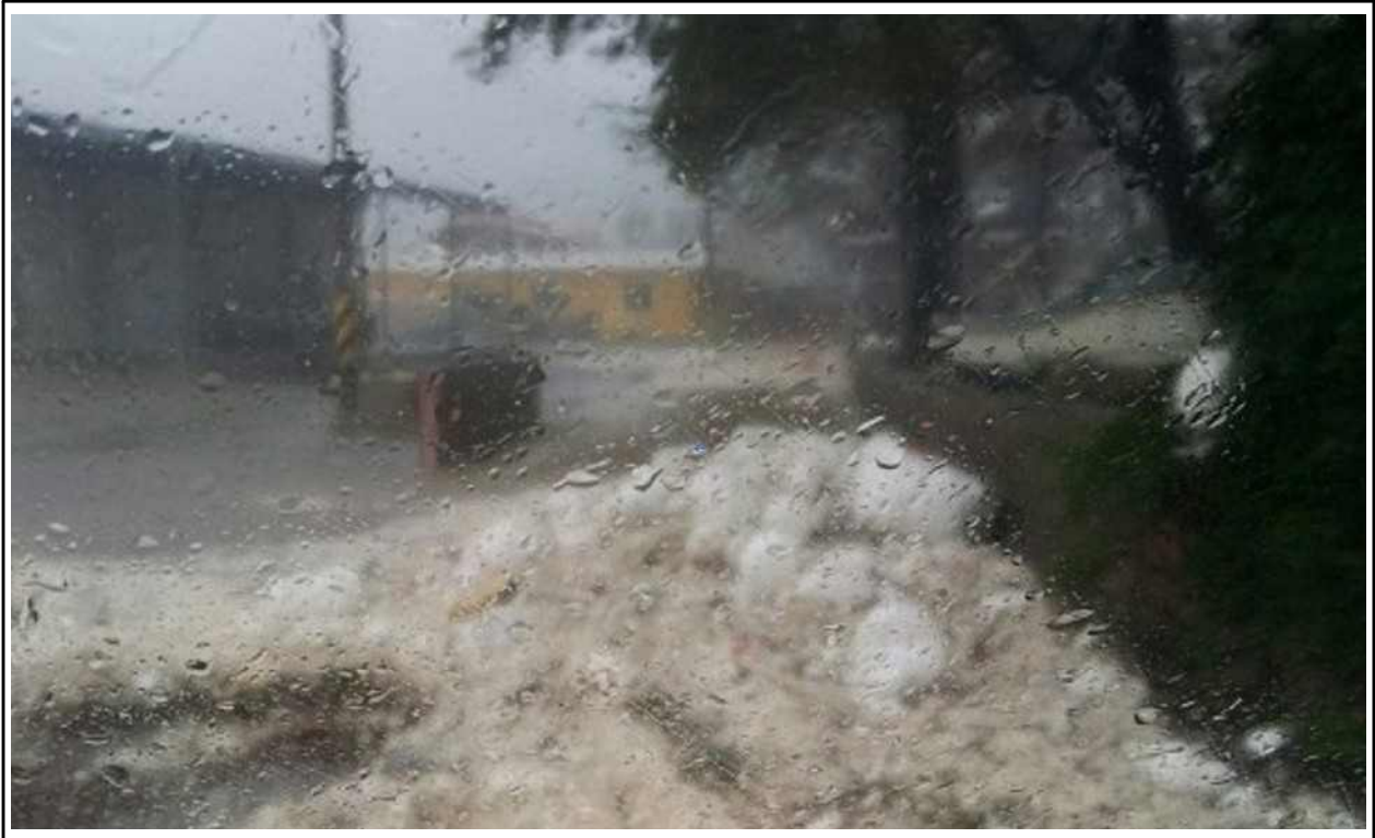
피해사진(피해기간 2012.09.16, 강우량 151.5mm, 최대시우량 59.0mm)