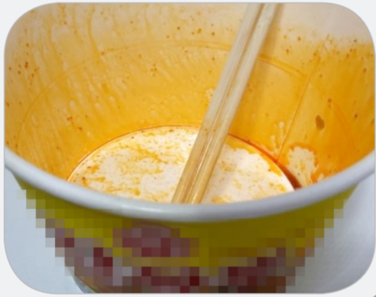
음식물 등 오염물질이 묻은 종이