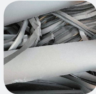
벽지 (합성수지 소재)